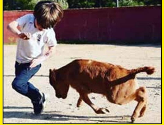
De niño probando su vocación al mundo de los toros