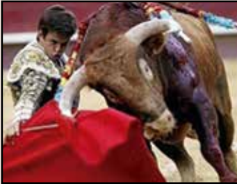
Julián López "El Juli"