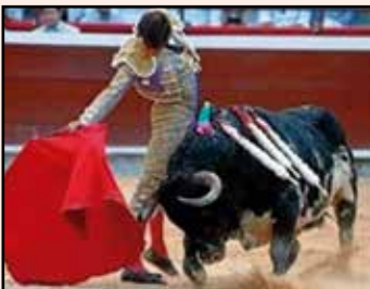
Andrés Roca Rey