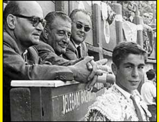
Francisco Rivera "Paquirri"