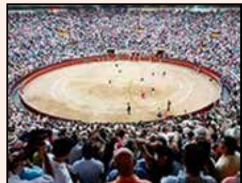
Leno completo cultura taurina