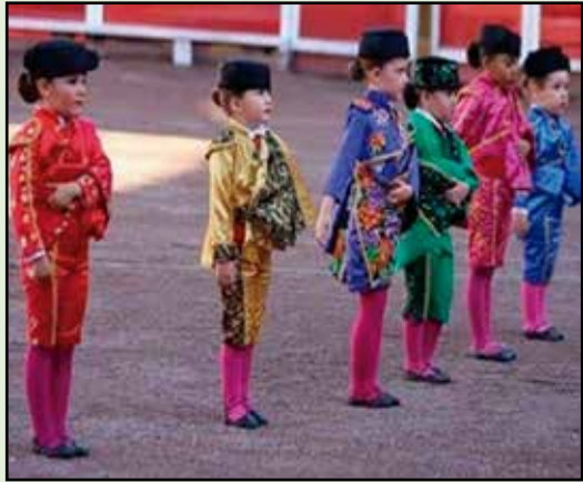
Los niños son el futuro de la fiesta brava