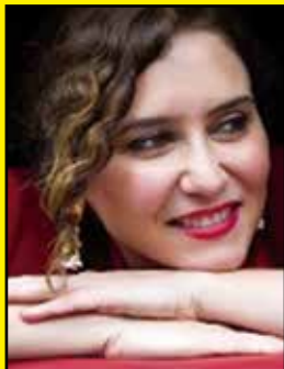
Isabel Díaz Ayuso