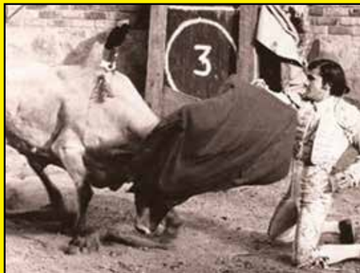
Omar Henao "El Pacoreño", matador de novillos toros