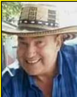
Miguel Escobar "El Federal"