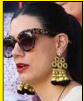
La taurina del año