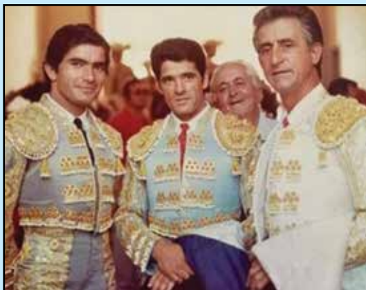
Los matadores de toros españoles José Luis Galloso, Paco Ojeda y Santiago Martín Sánchez "El Viti"