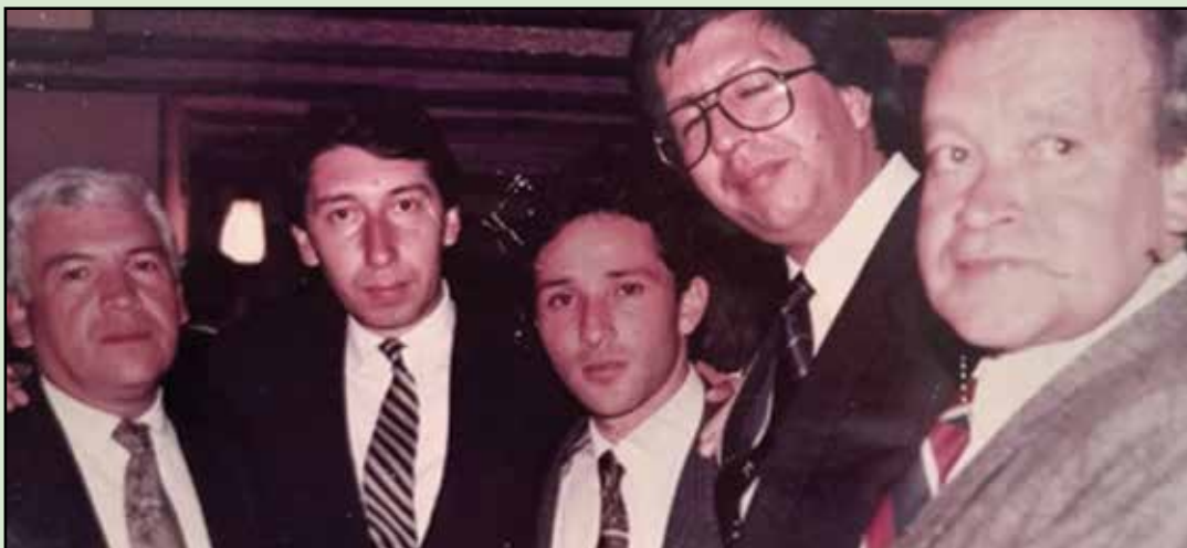
Leopoldo Portilla, Néstor Giraldo Mejía, César Rincón Ramírez, Santiago Pimentel y Guillermo Castellanos Díaz