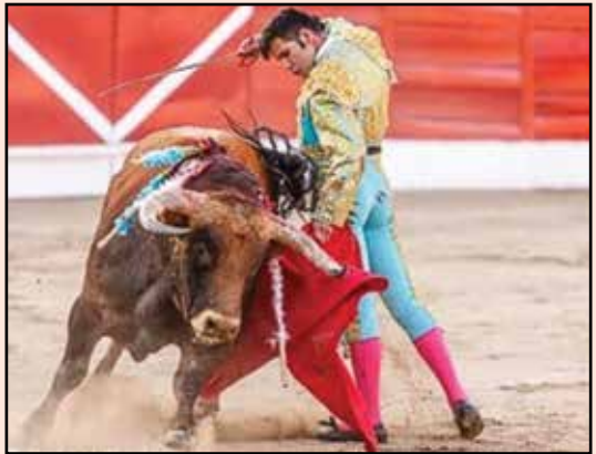
Matador de toros colombiano Juan Viriato, mostrando el arte de lidiar los bravos pitonudos