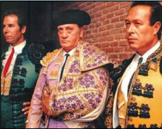
Los matadores de toros: Rafael de Paula, Antonio Chenel "Antoniete" y Curro Romero