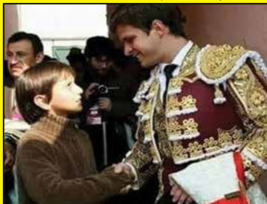
Sebastián Castella y Julián López "El Juli"