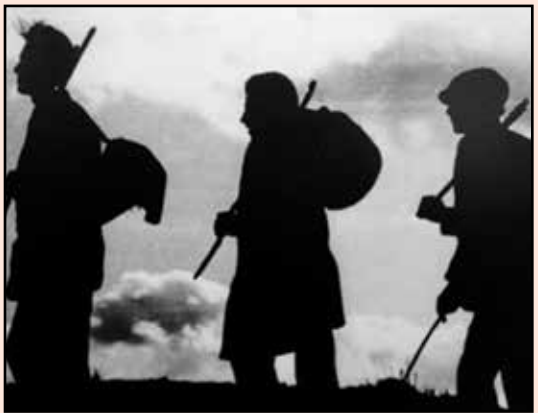
Cargados de grandes ilusiones taurinas se pasaron esos gratos momentos