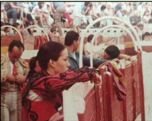
La torera Mireille Ayma