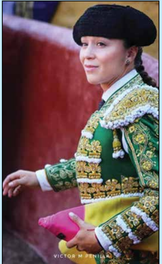
La única matadora de toros colombiana Rocío Morelli