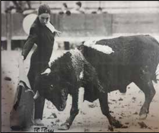
La torera francesa Mirelle Ayme en un templado derechazo