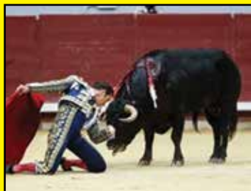
David Fandila "El Fandi"