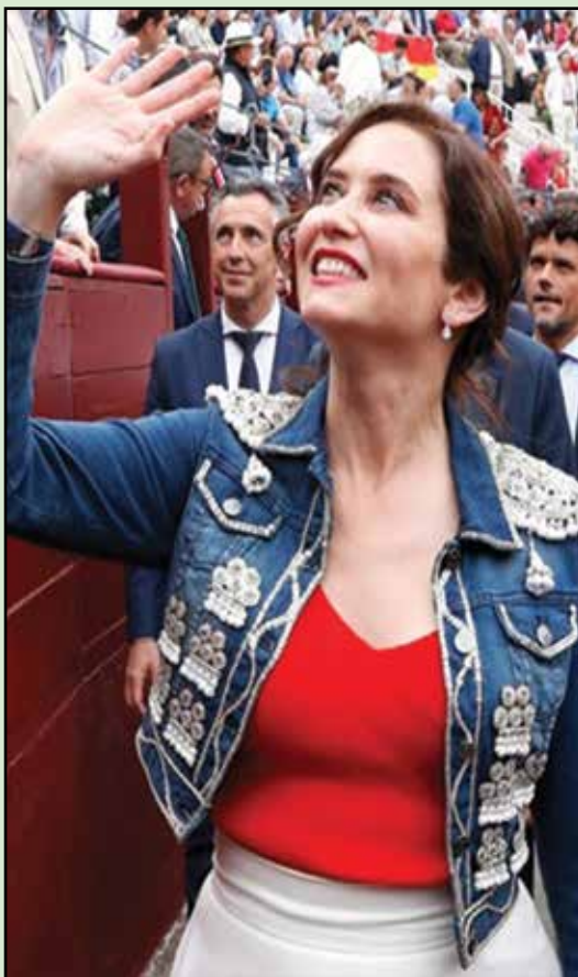
Saludo de Isabel Díaz Ayuso, la taurina más destacada en el mundo de los toros