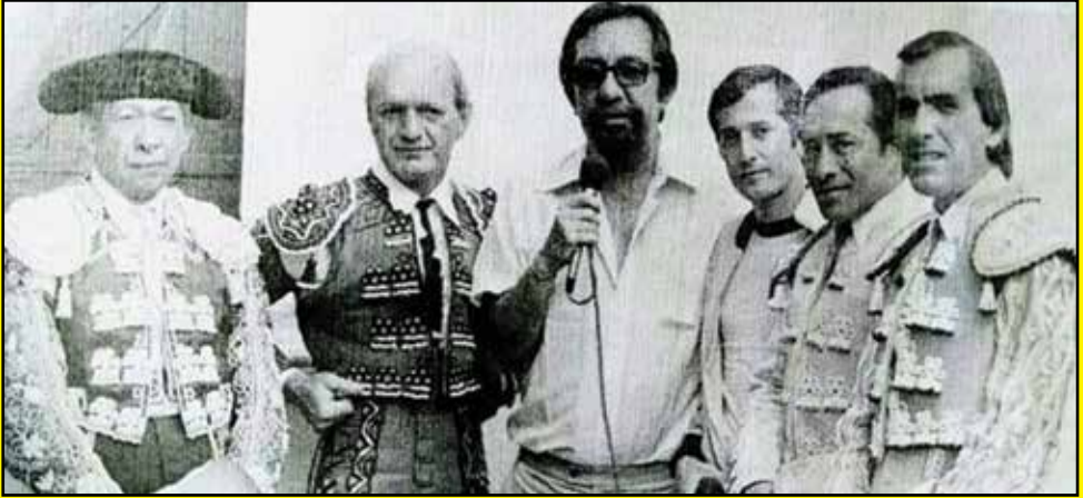
Alberto Restrepo "Cañitas", Carlos García "Maravilla", Fernando González "Pacheco", Alberto Lopera "Loperita", José Luis Gómez y Jaime Correa "El Piyayo"