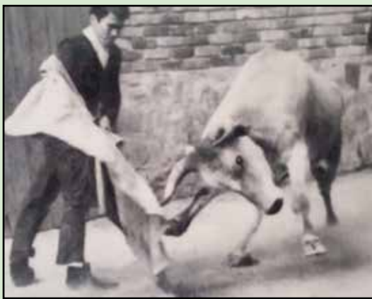
Reynaldo Belcastro "El Barcino", de gran trayectoria taurina