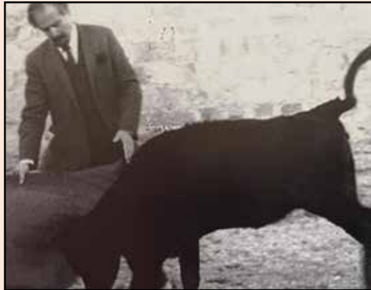
El escultor Fernando Botero