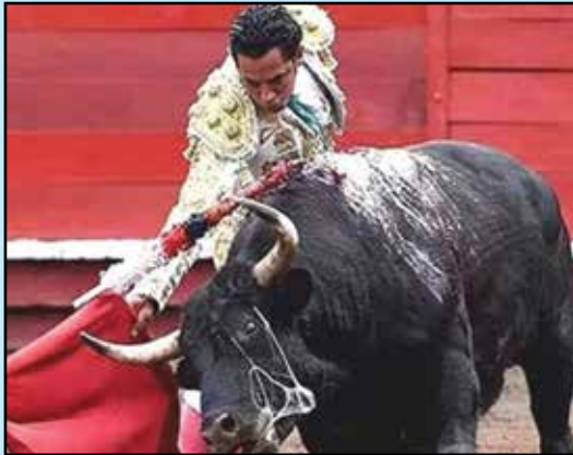
Así ejecuta el matador de toros colombiano Gustavo Zúñiga su original derecho con arte y mando