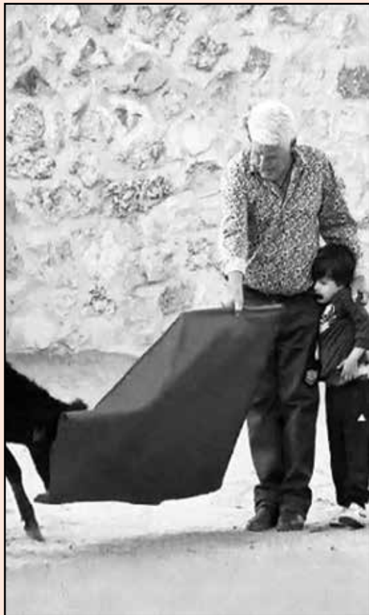
Momentos en los que el veterano torero explica las diversas facetas del arte del toreo