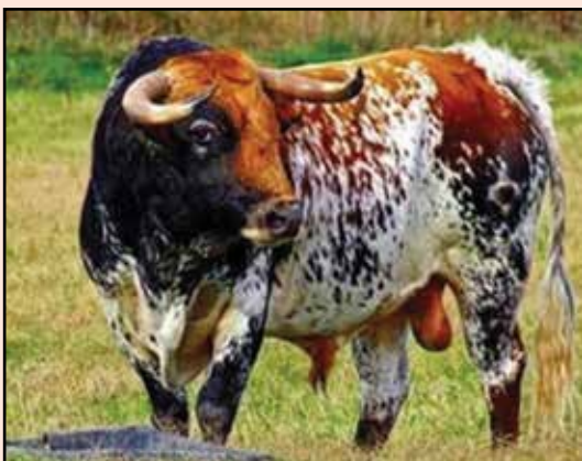
Toro castaño salpicado de blanco