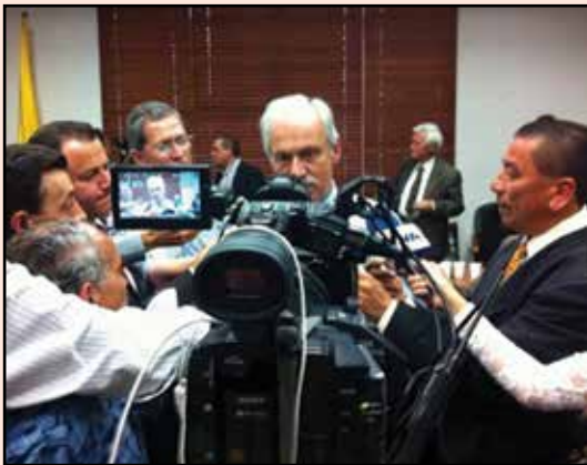
Rueda de prensa en la gobernación de Julián Gutiérrez Botero