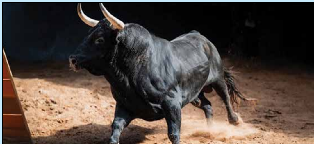
Toro con todo su poder, casta y bravura, denominado de bandera