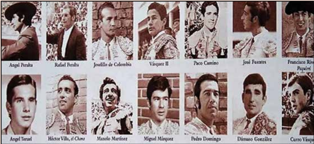
Los matadores de toros anacionales y extranjeros que fueron las figuras de ayer